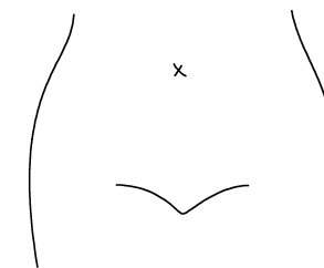
(腸瘻及びびらんの部位等を図示)