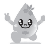
知立市水道事業 マスコットキャラクター 「みずっち」