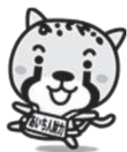
あいち人材力 強化プロジェクト イメージキャラクター 「アイチータ」