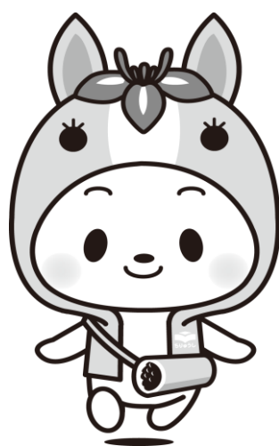
知立市マスコットキャラクター ちりゅっぴ

発行元 知立市議会事務局 住所 〒472-8666 愛知県知立市広見三丁目1番地 電話 0566-95-0137 (直通) F A X 0566-83-5565