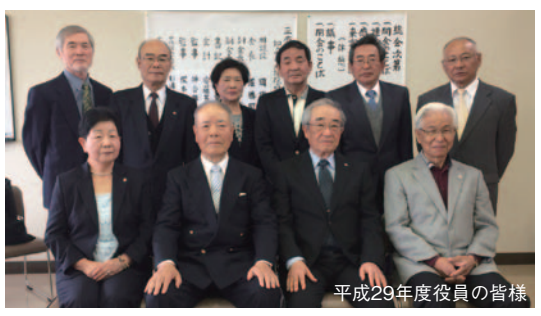
平成29年度役員の皆様

平成28・29年度の各クラブの会長および女性委員約90人が参加し、28年度事業報告、決算報告、29年度新役員選考、事業計画、会計予算が審議、承認されました。今年度も市老連では各種行事を企画していきます。広報で参加募集を行う行事もありますので、ぜひご参加ください。