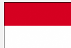
Bahasa Indonesia (インドネシア語)