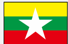
မြန်မာဘာသာ (ミャンマー語)