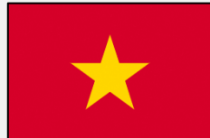
Tiếng Việt (ベトナム語)