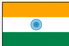
हिंदी अनुवाद (ヒンディー語)