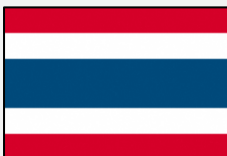
ไทย ล่าม (タイ語)