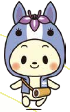
知立市マスコットキャラクター 「ちりゅっぴ」