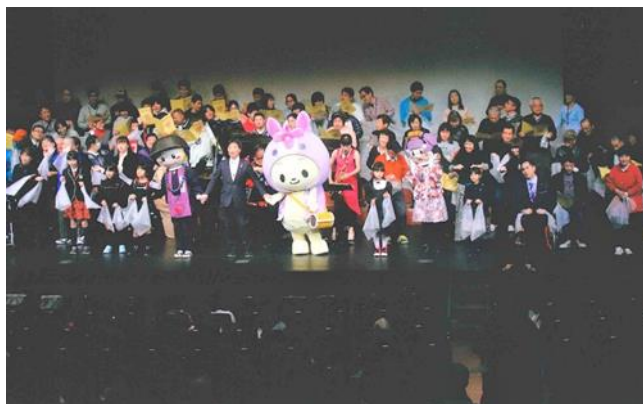
平成 29 年「ハートフルコンサート」の様子

「人にやさしい街づくり推進協議会」、「障がい者自立支援協議会」などに各団体会長が参加しています。