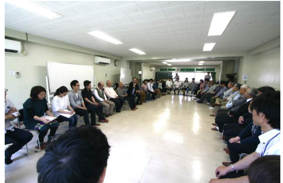
オープニング風景