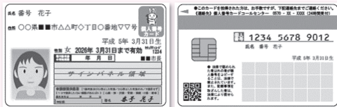
[個人番号カードイメージ]

券面に記載されるもの 【表面】氏名・住所・生年月日・性別・有効期限・顔写真 【裏面】12桁の個人番号（マイナンバー）・氏名・生年月日 【ICチップ】個人番号・氏名・住所・生年月日・性別・顔写真 ※所得情報などプライバシー性の高い個人情報記録されません。