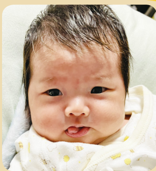
ふき 落ちゃん (1か月)