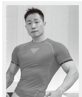
講師 順天堂大学先任准教授 日本オリンピック委員会医科学スタッフ 日本ボディビル連盟医科学委員