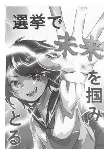
山本学園情報文化 専門学校高等課程1年 安達 有好菜