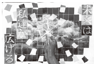
知立東高校1年 永井 優凪