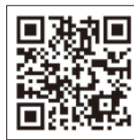
▲愛知労働局 ホームページ