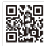
▲最低賃金に関する 特設サイト