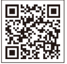
▲母子保健事業申込