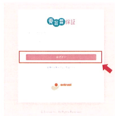
画面② ログインページ