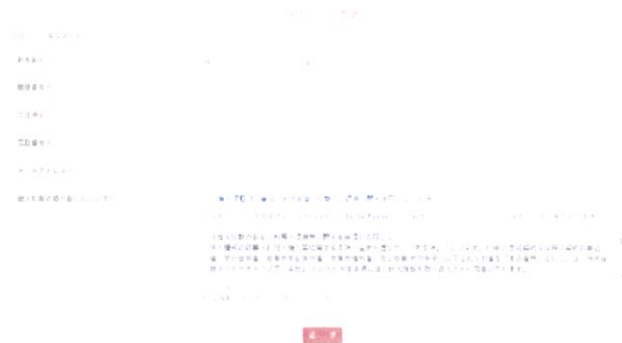
画面① マイページ登録

※ 仮パスワードが届かなかった場合、 お手数をおかけいたしますが youiku@entrust-inc.jp までご連絡ください。