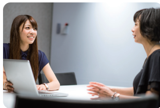
履歴書・面接指導