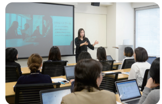
コミュニケーション講座