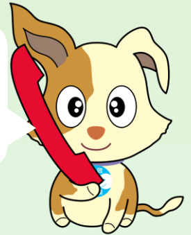
行政相談マスコット「キクーン」

困っていることがあるけど、国のことか、県や市のことか分からない時も相談できるよ。