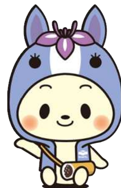
知立市マスコットキャラクター 「ちりゅっぴ」