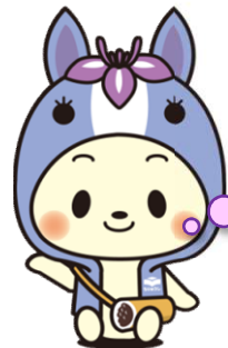
知立市マスコットキャラクター 「ちりゅっぴ」