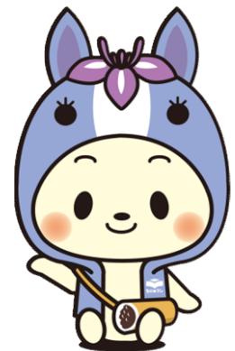
知立市マスコットキャラクター 「ちりゅっぴ」