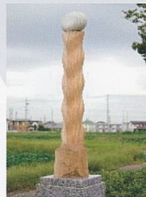
「大地の柱」 2010年制作 W50×D50×H230 cm 楠

大地から揺らめき柱状に立ち上がる姿「時の連続性」を、そして柱の上には、次の世代の世界を象徴するイメージとしての卵形としました。