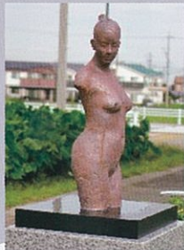
「声」 2015年制作 W41×D27×H107 cm テラコッタ