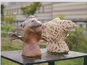
「キリン」 2013年制作 W70×D50×H110 cm テラコッタ

テーマは私の中の動物園です。ごく一部ではありますが、私の中のこうだったら面白そうだな、もしかしたらこんな感じになってたかもしれないという想像から出来ています。当時好きだった粘土で、私の中の一部を表現しました。少しでも皆様に興味をもって見てもらえたらと思います。