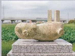
「中編の冒険ごっこ」 2011年制作 W70×D50×H60 cm さび石

自身の生きている存在場所と、そこに根づく文化や思想や感情等を明確にする為に作品を制作している。更に、彫刻は私にとって、この分かりにくい問題を分かりやすくビジュアル化してくれる方法である。どこにもアイデンティティを見出せない私が、確信の持てる新しいそれを発見する為の作品だ。