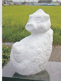
「疑惑」 2015年制作 W45×D75×H105 cm 大理石

自分の好きなものを好きなもので好きに作る その楽しさが少しでも伝えられたら嬉しいです。