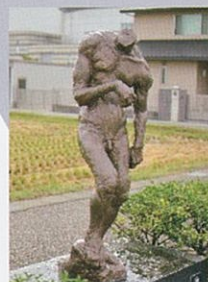
「もがく男」 2015年制作 W60×D65×H180 cm F.R.P

この作品は人体の動きや筋肉の運動性を意識して制作しました。なにか恐ろしいものの存在に気づいて身を翻して逃げようとする瞬間を動きのみで説明しなかったため、頭部は付けていません。まだまだ至らないところがありますが、大学の卒業制作という通過点としては満足しています。