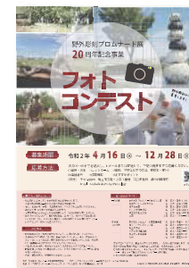
【フォトコンテスト A4チラシ】