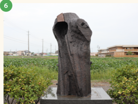
「BLOCKED」 名古屋造形大学 来島弘華