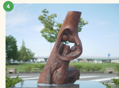
「Form 0605」 名古屋芸術大学 岩井義尚