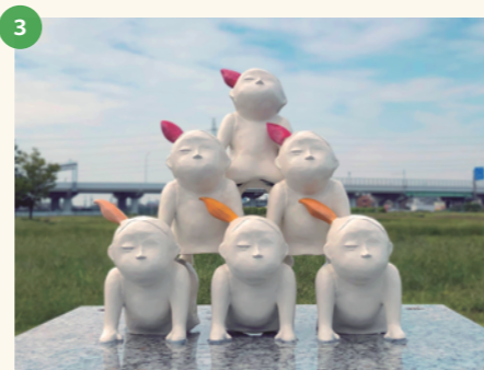
「GIRLS' WAR～カ・イ・カ・ン カテゴリーズ～ ver. 人間ピラミッド」 愛知教育大学 原 歩