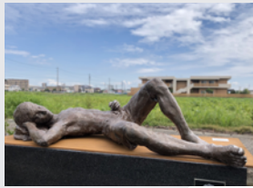
「自主休講」 2020年制作 W175×D80×H50 cm F.R.P

「自主休講」とは、大学生が講義をサボ る際に使う俗語です。私は、怠惰な部分 も人間を構成する大切な要素の一つで、 芸術的表現になりうるのではないかと考 えました。その為この作品では、日常生 活の中で人が見せる怠惰な一面に焦点を 当て、その一面を具象彫刻で表現しよう と試みました。