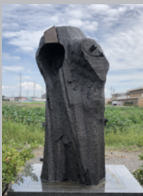
「BLOCKED」 2019年制作 W70×D60×H120 cm 木

木材の持つ暖かさや生の性質と金属やウール、日本 画材を合わせて、素材のアンバランスさや冷たく 痛々しい様子が伝わるように表現し制作しました。