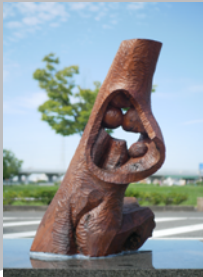
「Form 0605」 2006年制作 W66×D41×H93.5 cm 木（樺）

材木店にあったこの樺の原木を手に入れ…人には 色々な考えや悩みが有る…内面を表現するには内面 を彫るという直接的な行為で制作した作品である。