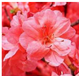
ヤマツツジダブル咲き