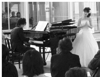
昨年のひなまつりコンサート