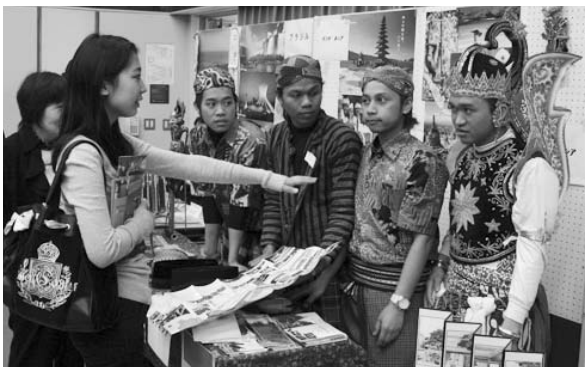
祖国の習慣や文化を紹介するインドネシア出身の皆さん。