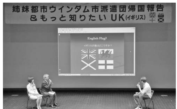
今年のもっと知りたいシリーズはイギリス！