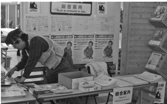
かきつばたホールでは、「子ども映画会」や「人権問題を考える講演会」などが開催されました。