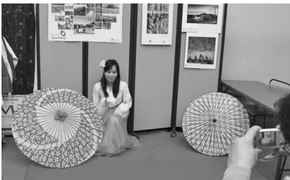
民族衣装で大変身！ポーズを決めて「はい！チーズ！」