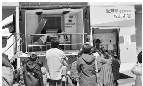
震度7までの揺れを体験できる地震体験車「なまず号」