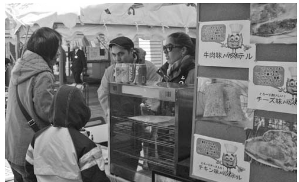
小さな屋台村には中国・ブラジル・日本各国の自慢の料理が並びました。