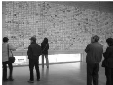
前回のギャラリー展

昨年3月に発生した東日本大震 災から1年が経過しようとしてい ます。私たちは、未曾有の災害に 直面された被災者の皆さんから多 くのことを学び、災害時の取り組 みについて見直す必要性を感じま した。