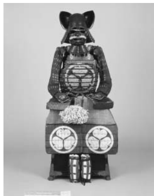
徳川家康より拝領の具足

型絵染で知られる芹沢銈介。彼は、暮らしの中から模様を生み出すと、絶妙な色彩感覚と構成力によって屏風や着物・帯などに染め上げました。本展では、郡上絨作家である宗廣氏が愛蔵する染色作