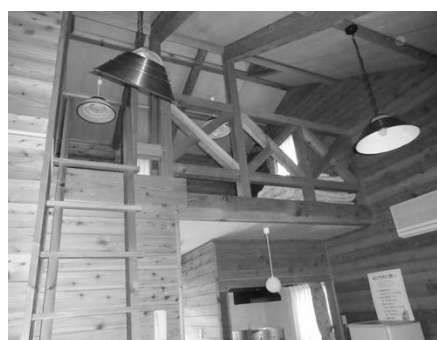
■ケビン (ロフト付き) 室内例