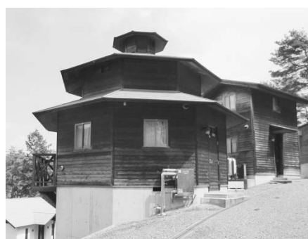
■ケビン (ロフト付き)