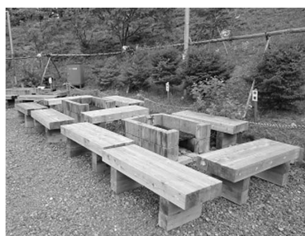
■バーベキュー専用炉