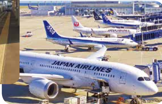
中部国際空港 セントレア