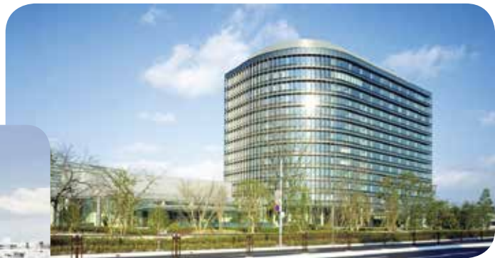
トヨタ自動車本社