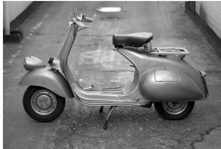
スクーター《ベスパ125cc》 1951年 ピアaggio社

▼ところ 岡崎市美術博物館(岡崎市高隆寺町字峠1番地) ▼料金 一般800円、小中学生400円 ※各種障がい者手帳をお持ちの人とその介助者は無料 ▼問合せ 岡崎市美術博物館(☎0564(28)5000)