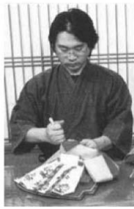
けやき(無垢)蒔絵屏風