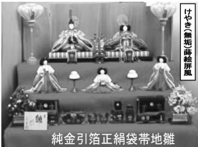
純金引箔正絹袋帯地雛