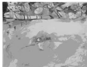
安永真梨子さんの作品