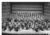
2010 パティオ・ニューイヤークンサート