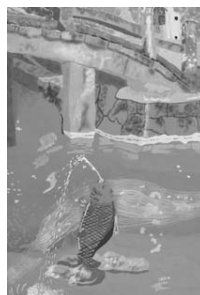
村瀬杏果さんの作品