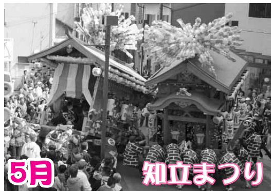
今年は「間祭り」となり、勢いよく回る花車に、大勢の見物客から歓声が上がりました。