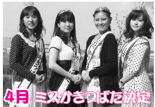
かきつばたまつりや知立よいところ祭りなど、さまざまな行事に華を添えてくれました。