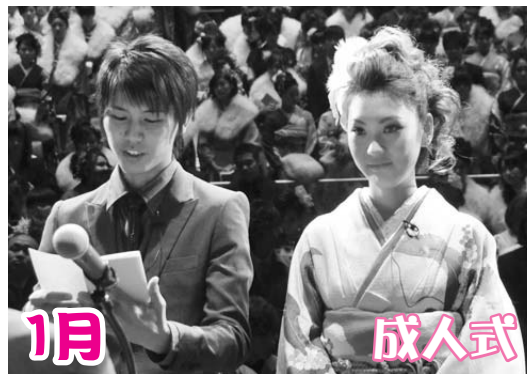
新成人の皆さんは、真新しいスーツや可憐な振袖に身を包み、晴れの日を祝いました。