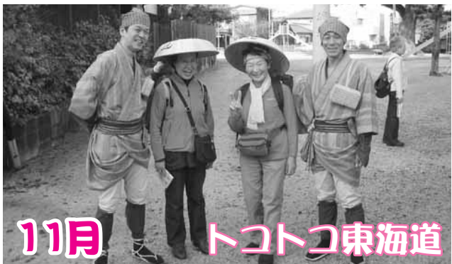
市内の名所旧跡をめぐり、途中には「やじさん・きたさん」に出会えるなど、楽しい旅路が用意されていました。