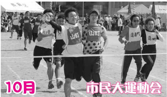
町内会対抗の種目では、選手も応援する人も、優勝目指し一丸となって奮闘しました。