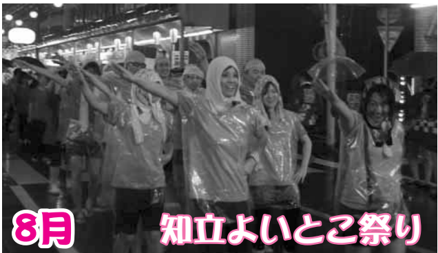
あいにくのお天気でしたが、路上総踊りは「雨ニモマケズ」元気いっぱいに行われました。