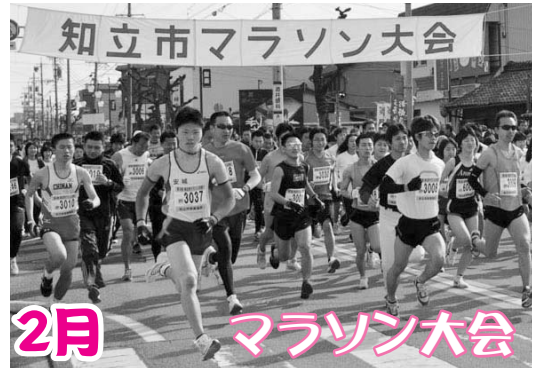
800人を超える市民ランナーの皆さんが、知立のまちを駆け抜けていきました。