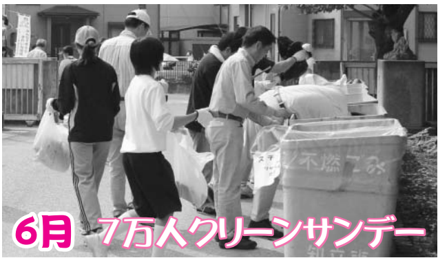
子どもからお年寄りまでたくさんの皆さんに参加いただきました。いつもきれいな知立市にしましょう。