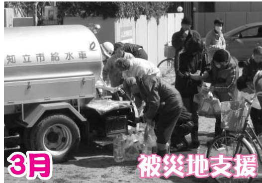
給水車派遣の後も、市からは窓口業務応援職員や保健師の派遣が行われました。