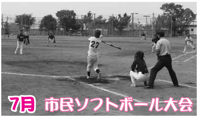
節電による企業の「土日操業」により参加チーム数が13と少なめでしたが、熱い戦いが繰り広げられました。