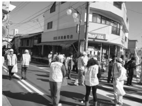
平成23年11月の弘法命日に行った啓発活動の様子

（具体的には、地域での環境美化巡回、市主催の環境美化に関するイベントやキャンペーンへの参加、環境美化に関する調査協力、年2回程度の会議開催などがあります。）