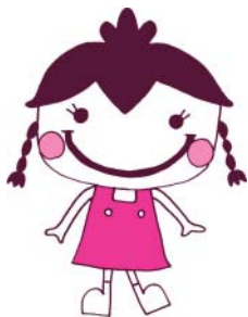
健康知立ともだち21啓発 マスコット「かつきー」ちゃん

定期的に検診を受けている人は、受けていない人よりもかかる医療費が低いという調査結果があるんだよ！ これは、早期発見で治療費が抑えられたのはもちろん、検診によって健康意識が高まったことが理由なんだよ。