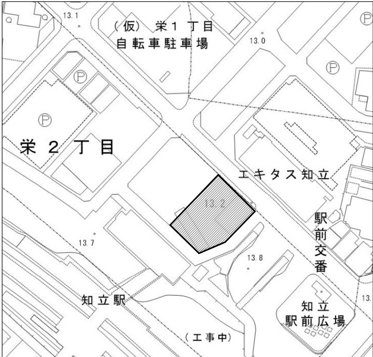
別図（第3条・第4条関係）