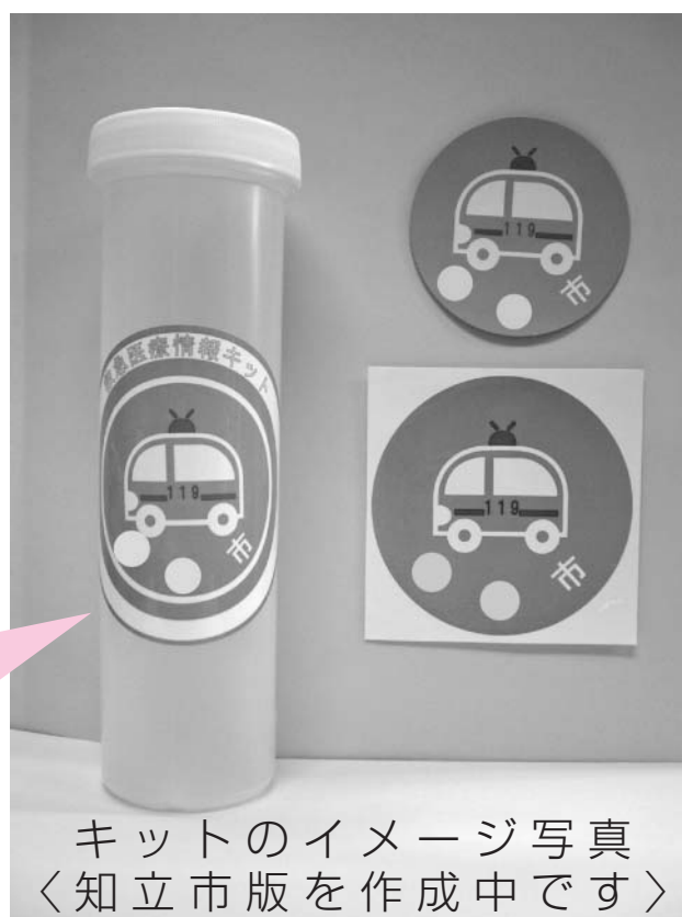
キットのイメージ写真 〈知立市版を作成中です〉

救急医療情報キットが冷蔵庫に入っていることを知らせるために、ステッカーを玄関ドアの内側と冷蔵庫の扉に貼り付けましょう。