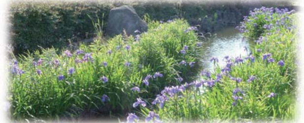
上:根上りの松(八橋町五輪付近) 下:明治用水西井筋線のかきつばた(来迎寺町御堂道付近・5月)