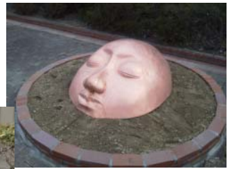
『ほほえむ人』 山本真由美 (設置場所:南新地一丁目地内 公園通)