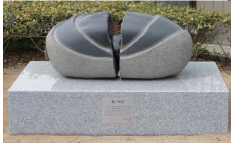
『殻一'10Ⅲ』 藤田雅也 (設置場所:本町地内 知立駅北交差点付近)

文化会館のエントランスロードに展示中の6体を含め、市内の道路や公園に設置されている彫刻作品は19体となりました。まちかどに彩りを添える作品達を、ぜひご覧ください。