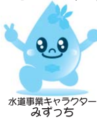
水道事業キャラクター みずつつち

水道は、私たちの快適な暮らしを支えてくれる大切なものです。しかし、あまりにも身近な存在であるため、その有り難さをつい忘れてしまっています。この機会に、水の大切さについてもう一度考え直し、私たち一人ひとりが水を上手に使い、無駄のないよう心掛きましょう。