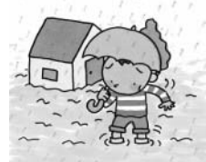
側溝の汚れ・つまりは浸水被害の元になります。