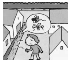
側溝に流された汚水は、蚊やハエ・悪臭発生の元になります。