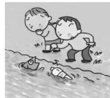
汚れたままの生活排水は自然環境を壊します。

下水道に流された排水は、地中管を通り、処理場できれいになってから河川や海に流すため、環境がよくなります。