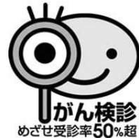
がん検診 めざせ受診率50%超

※平成25年4月20日以降に他市から転入した人は、クーポン券を知立市のものと引き換えてがん検診を受けていただきます。他市のクーポン券と本人確認のできるもの、印鑑を持参の上、保健センターにお越しください。