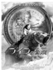
TM & (C) MMVII NEW LINE PRODUCTIONS, INC. ALL RIGHTS RESERVED.