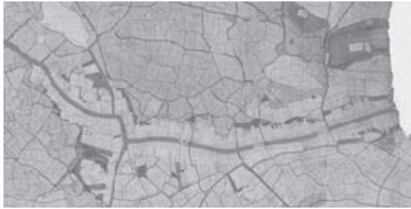
宿場時代を色濃く残す明治初期の地籍図 (宿場部分)

知立は江戸時代、品川から数えて39番目の宿場町として栄えました。現在、旧東海道をたどることはできませんが、その当時の様子をしのぶものは、町並みの中にあまり残っていません。 今回の展示では、江戸時代から現代までの数種類の絵図や地図を照らし合わせ、現在の通りが、かつて池鯉鮒宿の時代にどのような町並みであったかを紹介します。 また宿場の様子を描いた浮世絵や、池鯉鮒の旅籠で使われていた道具なども展示します。