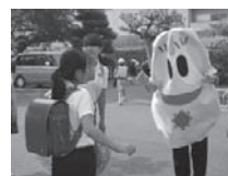
知立東小学校のあいさつ運動の様子

テレビ、携帯電話、スマートフォン、ゲーム、パソコンの合計は健康のためには3時間までにしましょう。 そのうちゲーム(携帯・パソコンのゲームを含む)は1時間までにしましょう。ゲームの時間が1時間以上の子は、小中学生ともにテストの成績が平均点を下回っています。(H25全国学力・学習状況調査)