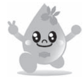
知立市水道事業 マスコットキャラクター 「みずっちゃん」