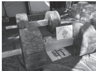
[新たに整備された車輪と車軸]

宝くじの社会貢献広報事業により、西町の山車車輪および車軸が整備されました。今回の事業では、車輪4個がマツとカシの寄せ木方式、車軸2本がカシで製作され、二年に一度の知立まつりの本祭りの山車に使用されます。