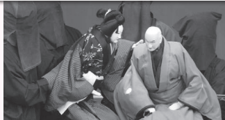
③午後3時から<中新町人形連> 「壺坂観音霊験記」沢市内より山の段