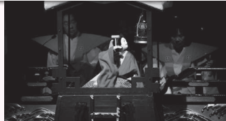
④午後3時40分から<本町人形連> 「伊達娘恋緋鹿子」火の見櫓の段