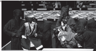
①午後2時から<宝町人形連> 「傾城阿波の鳴戸」十郎兵衛住家の段