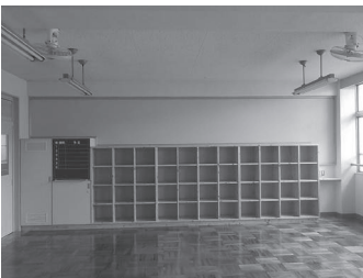
普通教室 (イメージ写真)

・木質感のある校舎にリフレッシュ 普通教室内のロッカーや造り付け棚等を木製にし、廊下との間仕切り壁等を木目調のものにする事で、あたたかみのある校舎になります。