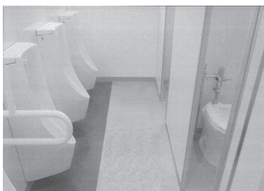
トイレ (イメージ写真)

トイレは和式便器をひとつ残し、全て洋式便器を設置します。一部には手すりも設置し、より快適にトイレを利用できるようになります。