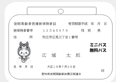
(パスケースイメージ図)