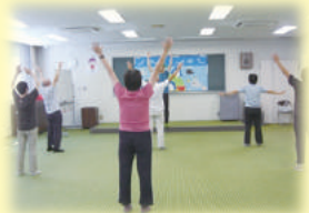
集団指導（メタボ講座）