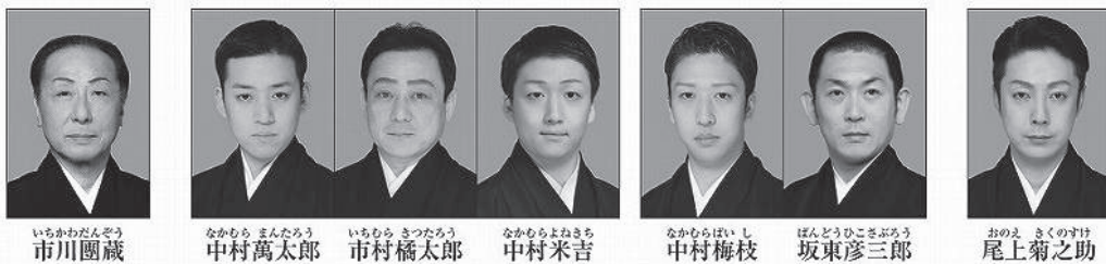
いちかわだんぞう 市川團藏

※車椅子席・親子室席のチケット予約は文化会館アートセンターへ事前にご連絡ください。(席に限りがあります。)