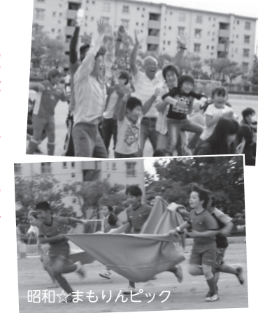
昭和☆まもりんピック

なるとは、参加者で「昭和地区の理想の未来」について語り合いました。年齢や職業、国籍も異