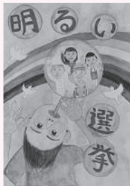
前川久侑羽 (猿渡小 5年)