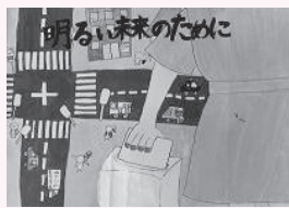
中村叶恋 (知立小 6年)