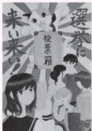
石川夏輝 (山本学園情報文化専門学校高等課程 3年)