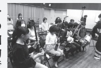
刈谷・知立・安城おやこ劇場